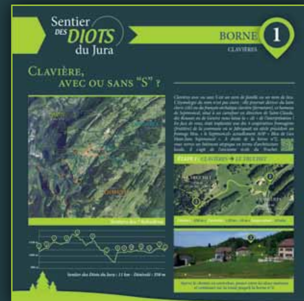
Exemple de borne pédagogique