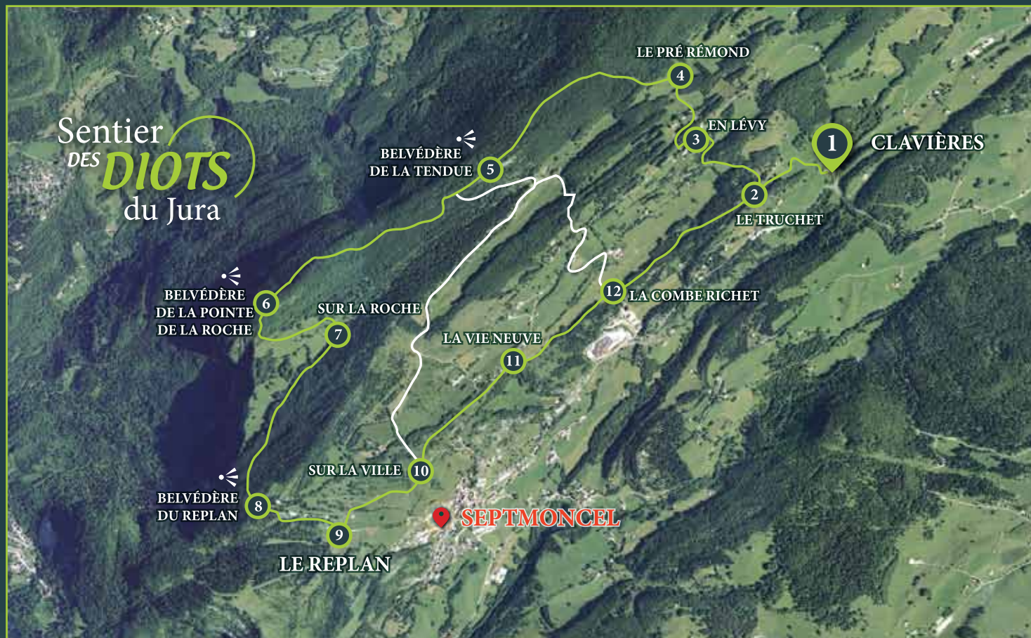
Parcours complet du sentier des Diots du Jura